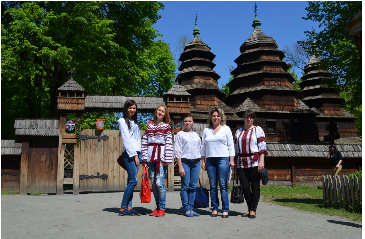
Бойківська церква с. Кривки

дослідник стародавнього українського мистецтва Михайло Драган зумів переконати селян у тому, щоб вони стрималися із її розбиранням. Завдяки наступним клопотанням на кошти митрополита Андрея Шептицького в 1930 році церкву під наглядом та керівництвом М. Драгана було розібрано, перевезено й зібрано у Львові як церкву для потреб монастиря о. Студитів. Так була врятована ця перлина бойківської церковної архітектури, якій судилося дати початок сучасному Музеєві народної архітектури і побуту «Шевченківський гай» і стати в майбутньому його окрасою.