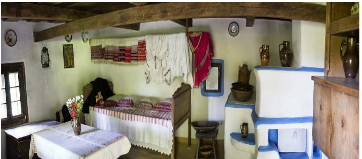
Інтер'єр садиби із с. Крайниково Хустського району, Закарпаття.

До складу садиби входить хата, комора, возівня і хлівець. Возівня і хлівець перевезені із с. Сокиринці Хустського району. Хата складається із житлової кімнати, комори та кухні. Стіни зроблені із дубових плах, тинковані та побілені. Відтворена у 1977 р.