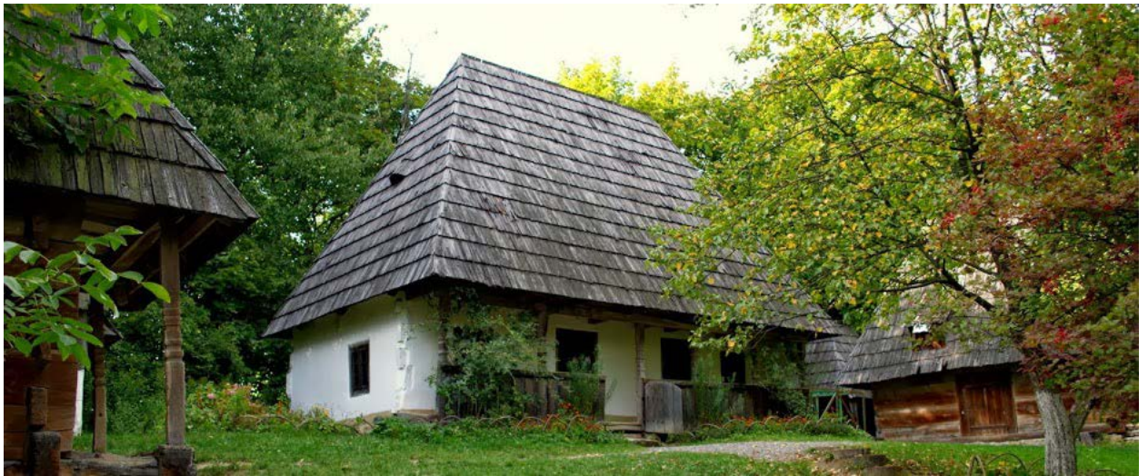
Садиба поч. 20 ст. із с. Крайниково Хустського району, Закарпаття.

До складу садиби входить хата, комора, возівня і хлівець. Возівня і хлівець перевезені із с. Сокиринці Хустського району. Хата складається із житлової кімнати, комори та кухні. Стіни зроблені із дубових плах, тинковані та побілені. Відтворена у 1977 р.