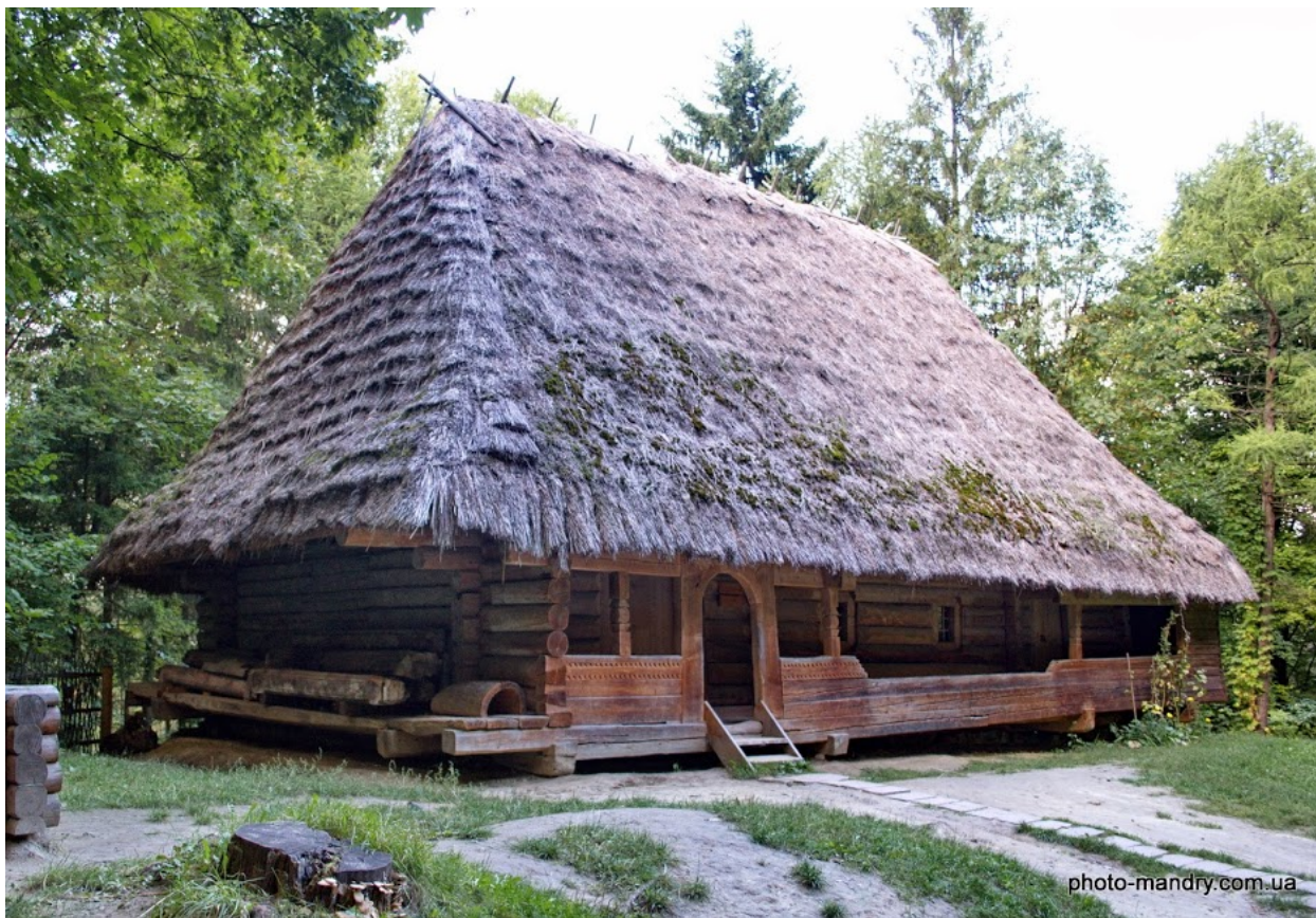
Типова Львівська садиба