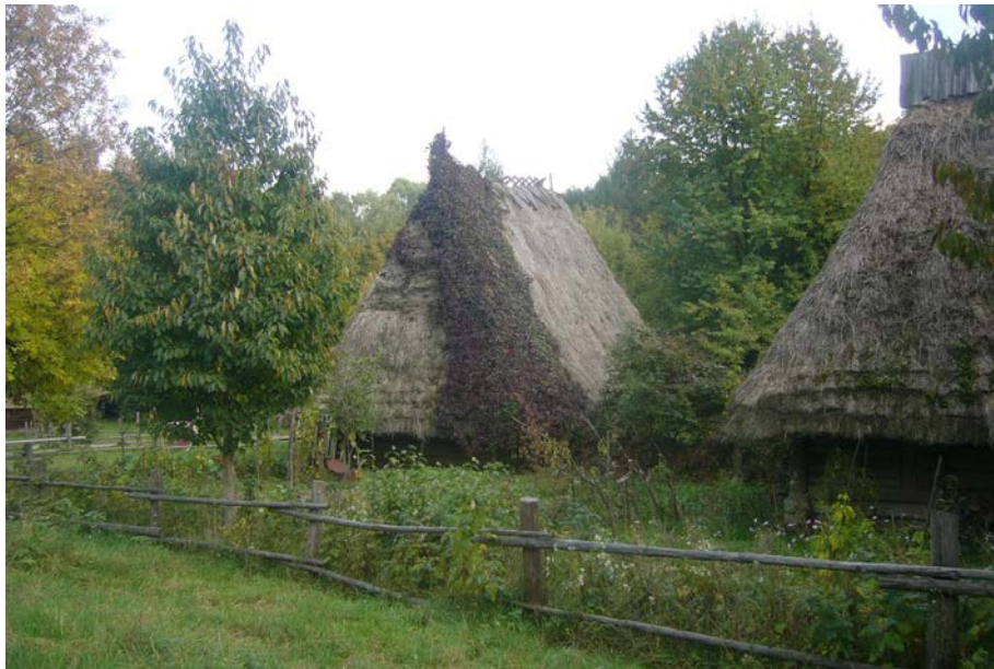
Садиба середини ХІХ століття з с. Пилипець

Цінними експонатами у скансені регіону є сільська садиба з будинком 1812 року і стайнею 1903 року з села Либохора Турківського району, бойківська хата 1909 року з села Тухолька, Сколівського району. В цій частині експозиції є дві церкви.