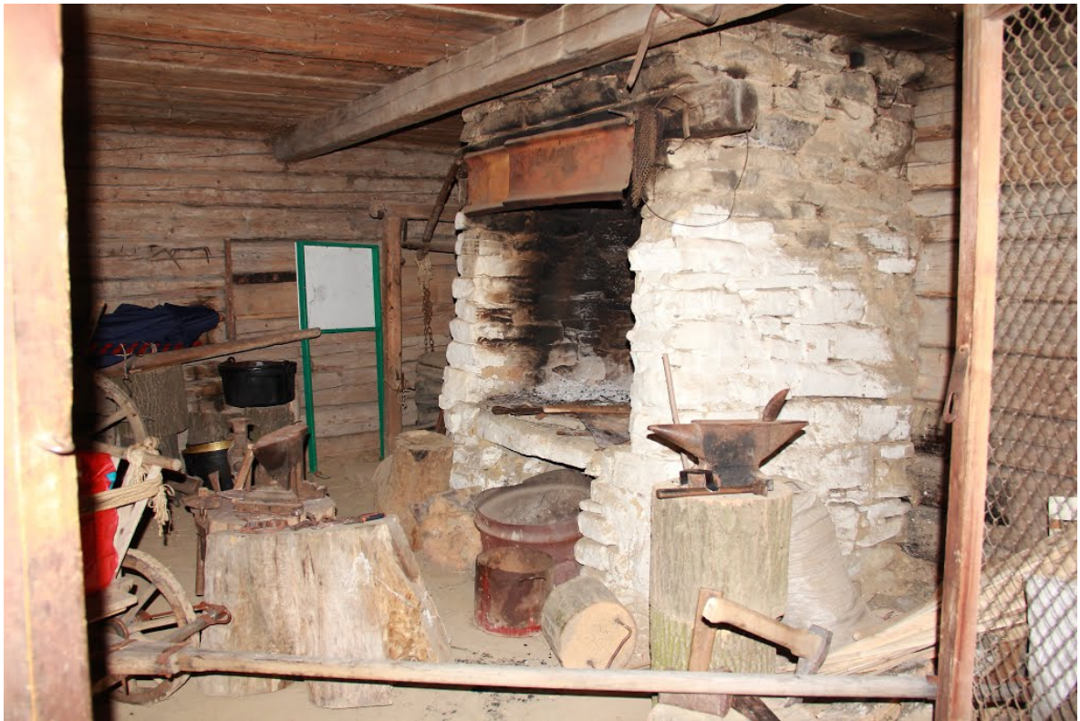
Лемківщина. У кузні.

III. Гуцульщина — український етнокультурний регіон, край українських верховинців — гуцулів, розташований у Західній Україні. межа пролягає лінією Зелена — Делятин — Яблунів — Пістинь — Косів - Кути (Косівський район) — Вижниця, іноді межі Гуцульщини ширять аж до Коломиї, Надвірної, Солотвина й Монастирчан; на південному заході гуцули заселяють усю долину Тиси на північ та південь від Рахова; східна межа Гуцульщини — лінія Вижниця — Берегомет — Мигове — Банилів-Підгірний. Кілька гуцульських сіл (село Поляни та його околиці) є і на румунській Мармарошині.