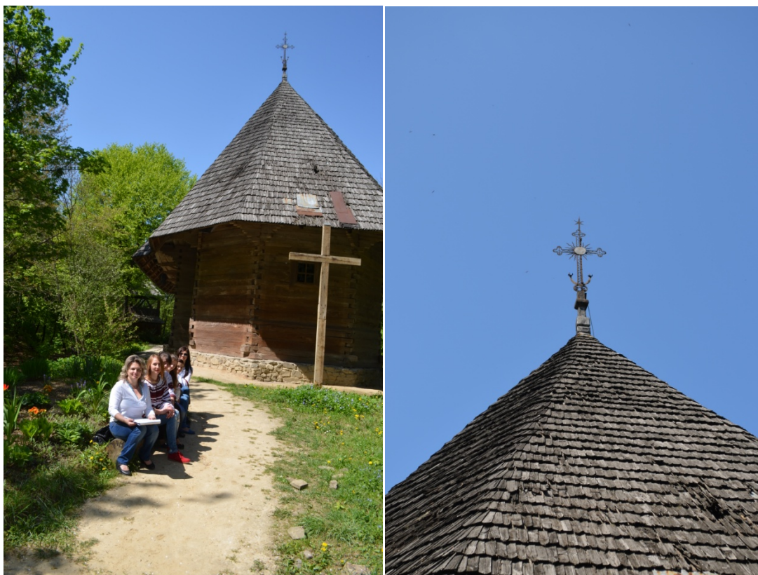
Троїцька церква із передмістя Чернівців (Клокучка).

Збудована у 1774 р. у Чернівцях і служила єпископальним собором. В 1874 р. її перевезли в Клокучку. Споруда складається з трьох дубових зрубів різної величин і конструкцій. Центральний зруб – ширший і вищий, перекритий восьмигранником. Над бабинцем – чотиригранний верх у формі зрізаної піраміди. перекриття над вітварем – напівсферичне. Верхи зрубів сховані під єдиним високим дахом, тому своїм силуетом храм нагадує звичайну хату. Церква перевезена в музей у 1969 р.