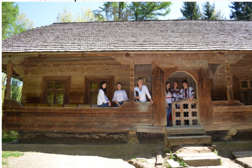
Бойківська хата 1910 р. з с. Тухолька, що на Сколівщині.

Бойківська хата складається з двох житлових приміщень, розділених