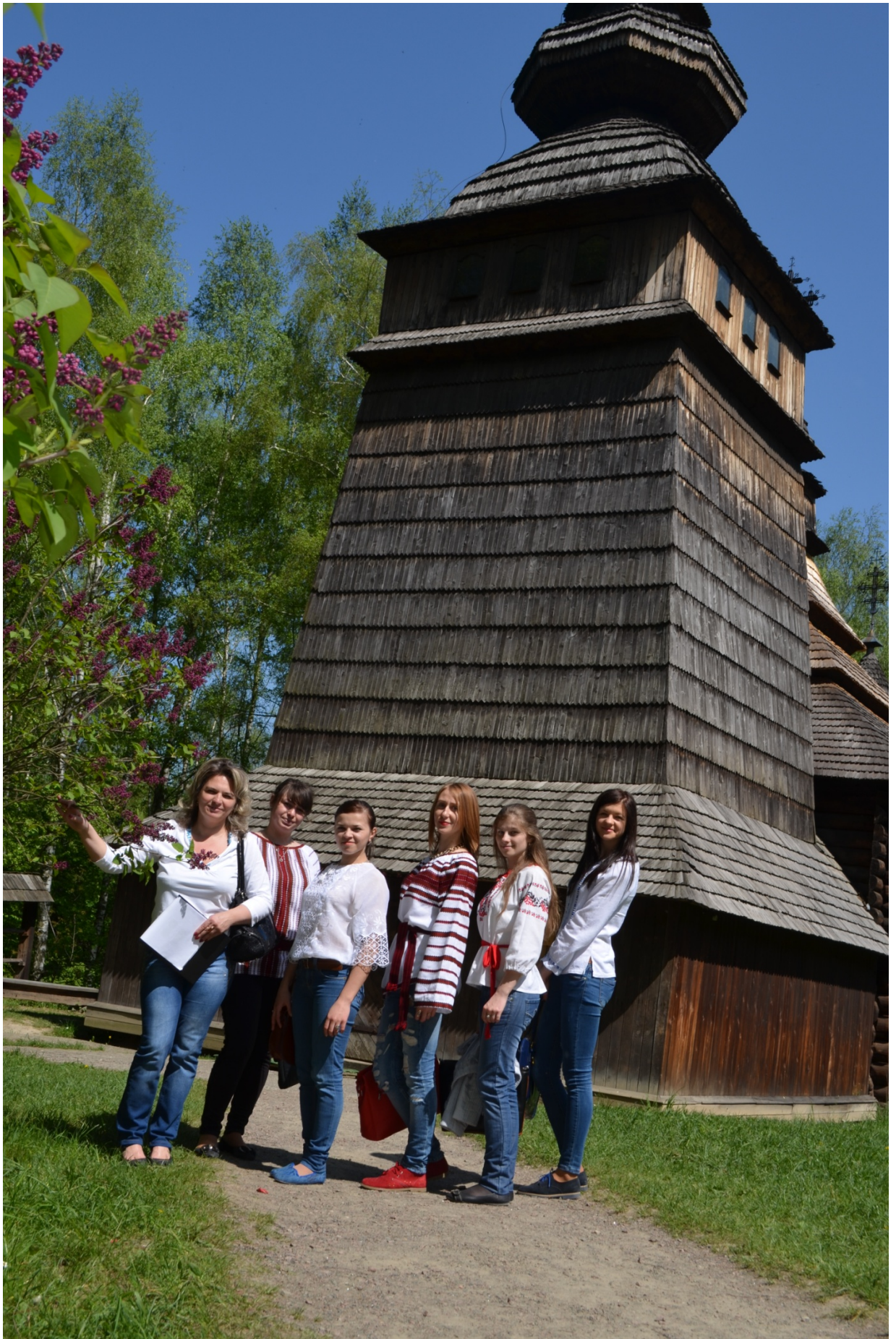
Церква св. Володимира і Ольги.