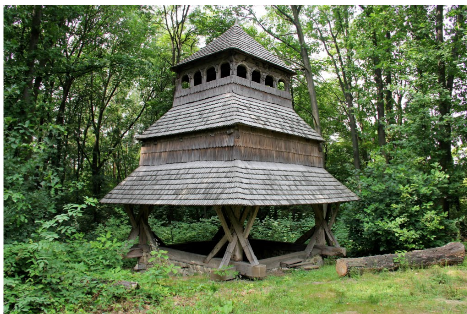
Двіниця Миколаївської церкви

Миколаївська церква на Поділлі (1773 р.) с. Соколів Бучацького району Тернопільської області.